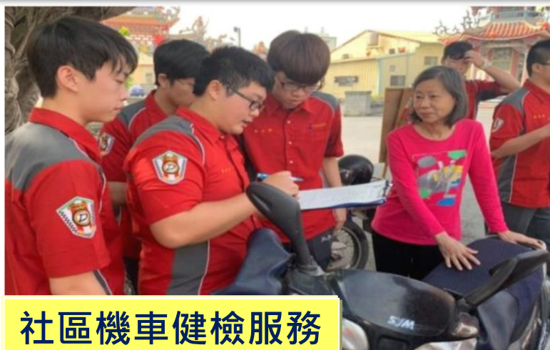
社區機車健檢服務