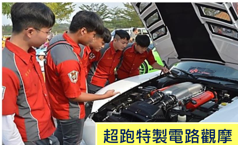
超跑特製電路觀摩