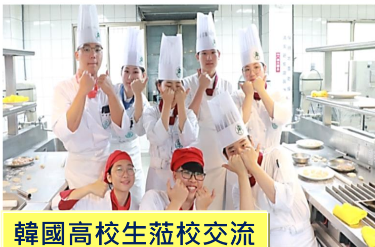
韓國高校生蒞校交流