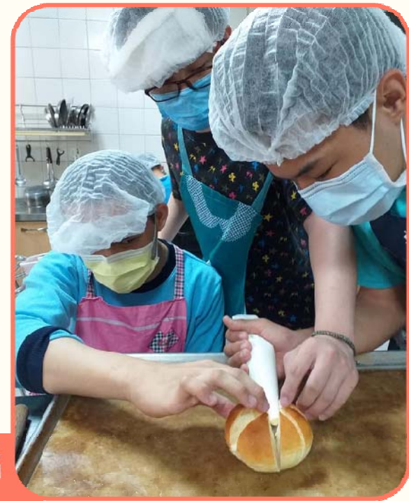
學生間進行分工，將麵包填餡