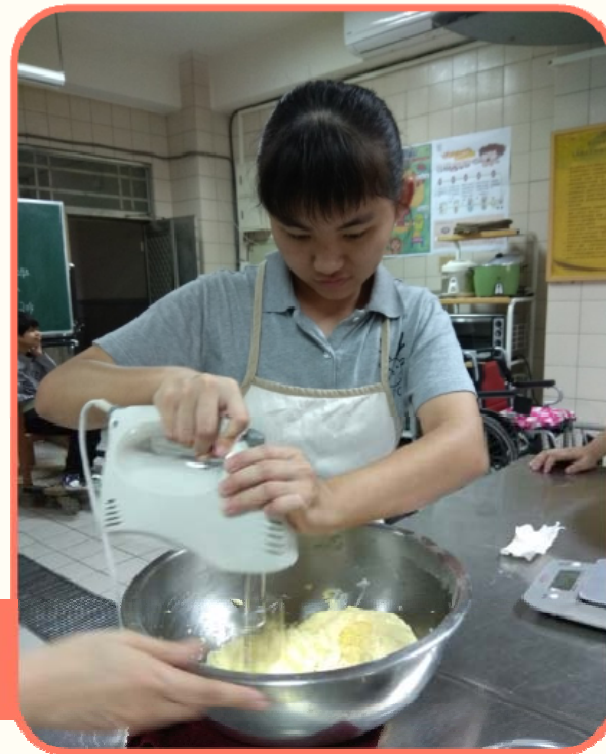
學生運用器具進行麵團製作