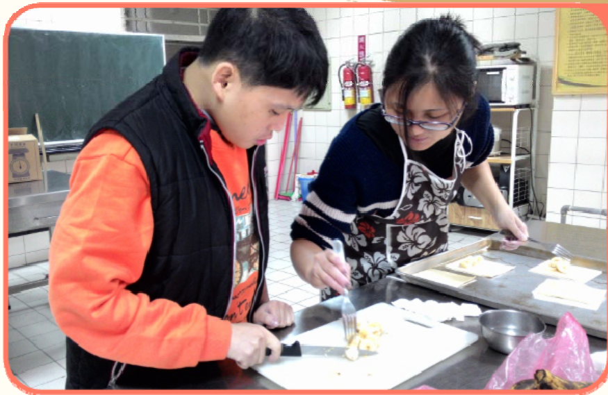
學生在教師提示協助下將香蕉切片