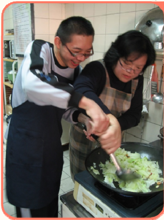
學生在教師協助下操作