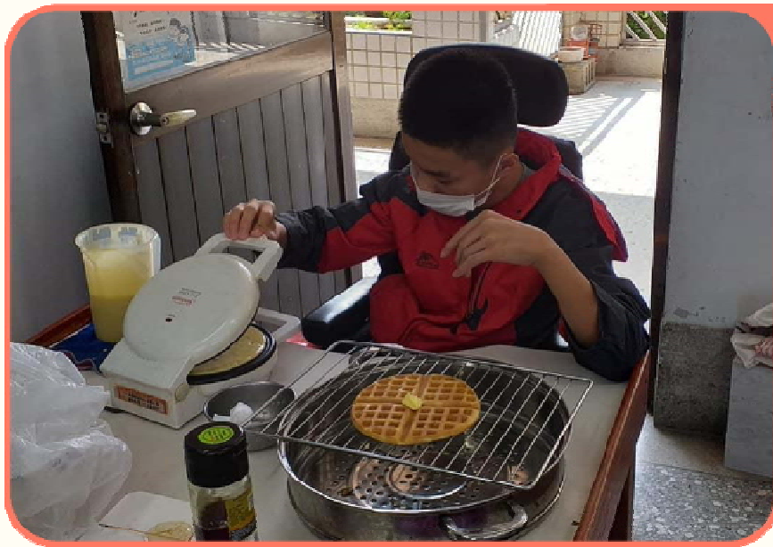
校內實習進行商品製作