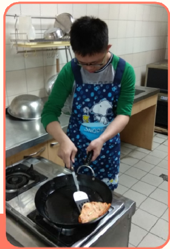
學生獨立操作炒的烹調法