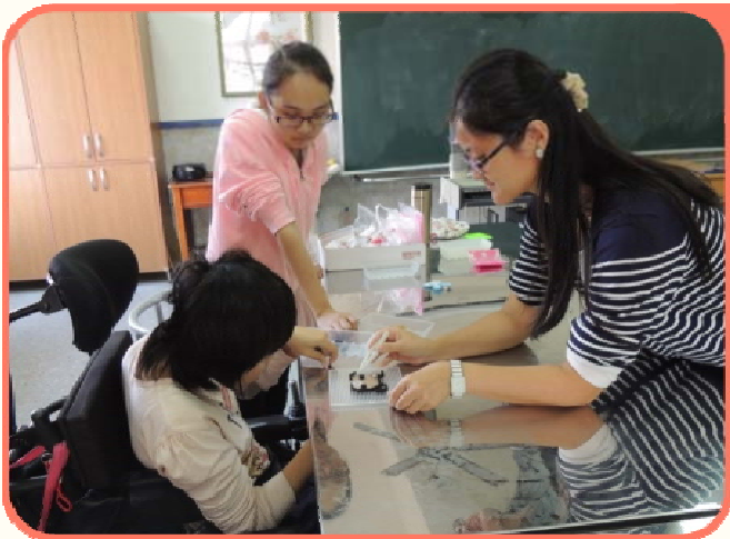
學生在教師協助下進行課程