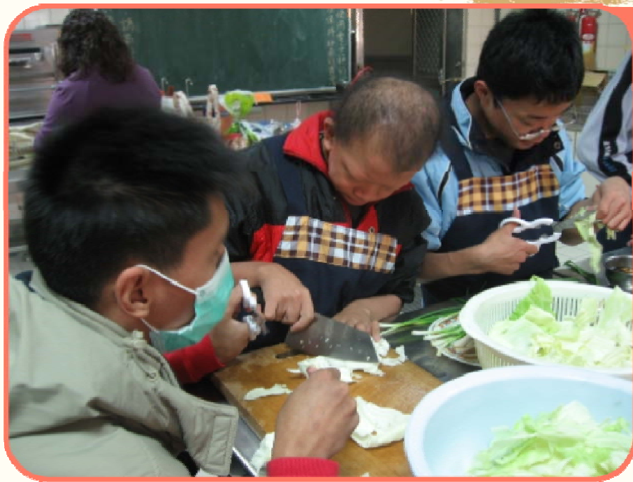
學生使用適合的工具處理食材