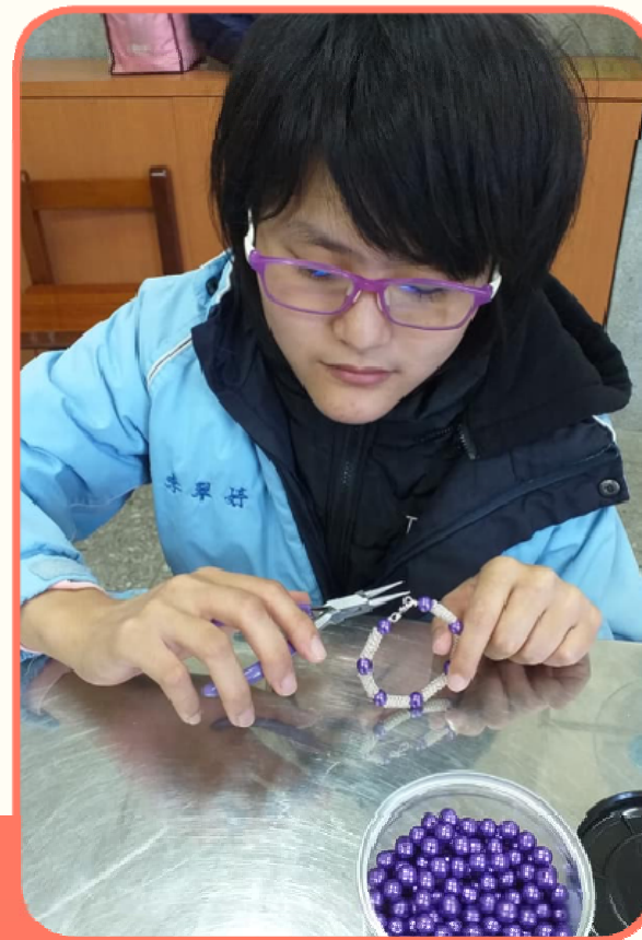
學生將金屬線與珍珠結合