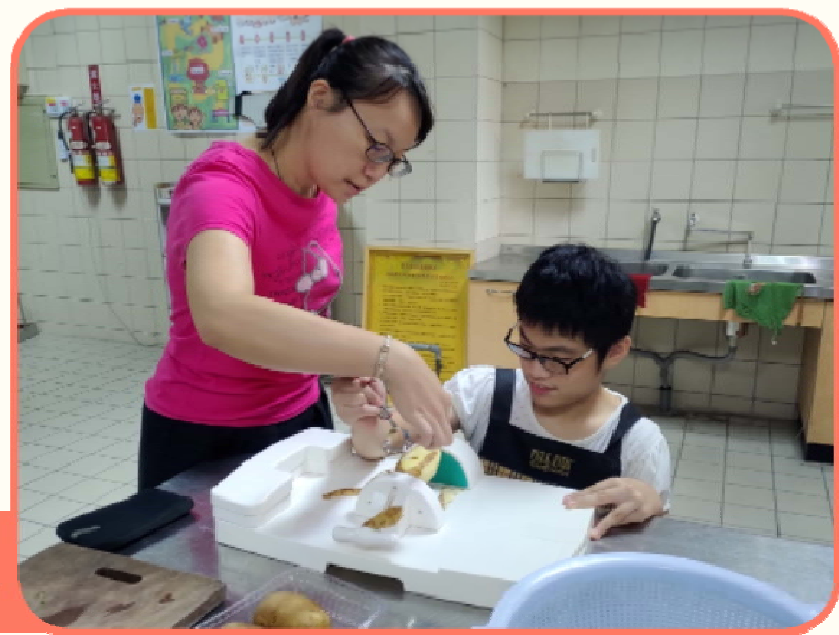
輔具協助固定食材，學生削皮