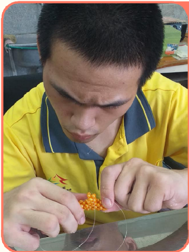
學生製作串珠作品