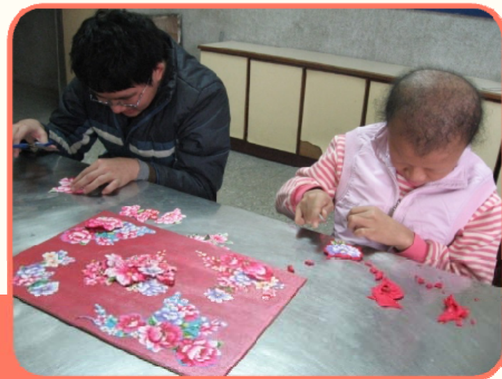
蝶谷巴特立體雕花製作